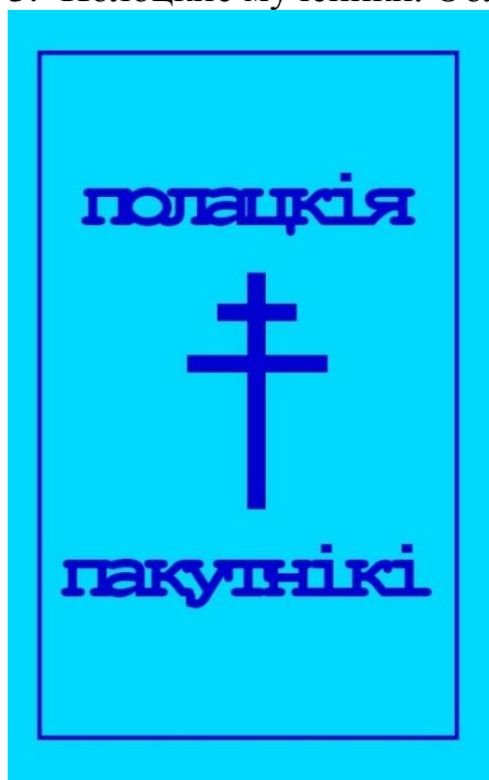
4. Полоцкие мученики