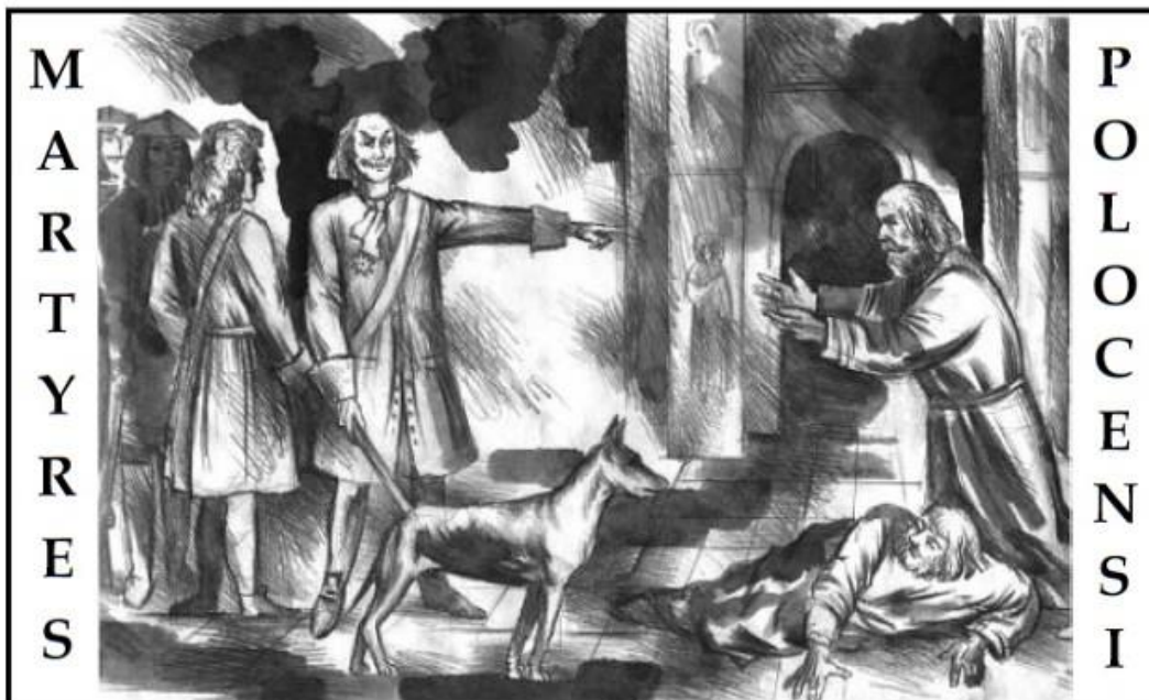
Забойства полацкіх манахаў - базылянаў у катэдральнай царкве Сьв.Сафіі